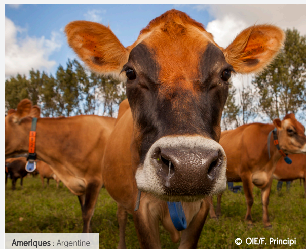
Ameriques : Argentine

Depuis 2001, ces activités et d'autres ont permis à l'OIE de se positionner comme contributeur mondial unique en matière de bien-être animal , à la demande de ses États membres.