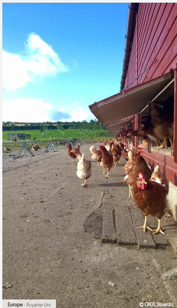
Europe : Royaume-Uni